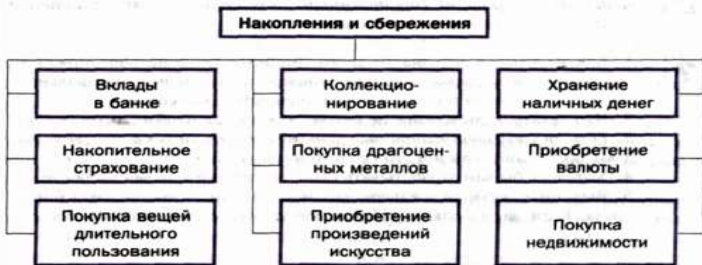
Рис. 2 Способы сбережения денежных средств семьи